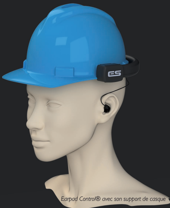
Earpad Control® avec son support de casque

Le protecteur n'est plus la propriété exclusive de l'utilisateur.